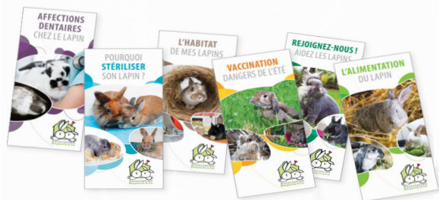
Dépliants informatifs de l'Association Marguerite & Cie

Le premier rôle des associations est de recueillir les animaux abandonnés, les soigner et les préparer à intégrer une nouvelle famille. Les associations jouent également un rôle très important de pédagogie. Les NACs sont en effet concernés par la maltraitance, que ce soit par négligence ou par ignorance. Parce qu'ils sont souvent de petite taille, ces animaux se retrouvent dans des habitats ne respectant pas leurs besoins. L'une des missions des associations est d'informer sur les besoins essentiels des animaux et de sensibiliser le grand public afin d'améliorer la vie des NACs.