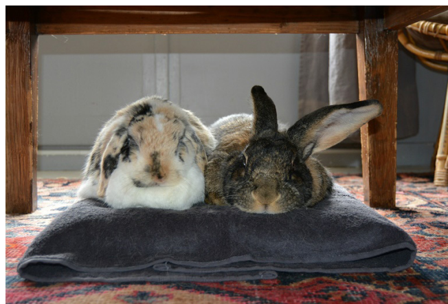
La présence d'un congénère est souvent apaisante.

Votre lapin peut parfois vous mordiller ou gratter vos vêtements. Ce n'est