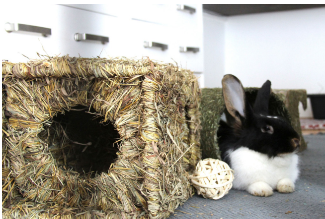
Il existe de nombreux jouets à ronger.

inhabituel, il est impératif de l'emmener rapidement consulter son vétérinaire. S'il a mal quelque part ou souffre, faites attention à limiter les manipulations qui peuvent augmenter sa douleur.