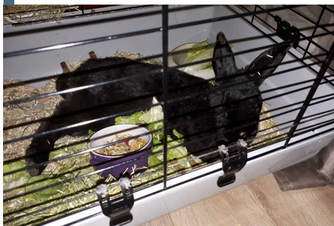
La cage est un habitat inadapté.

Tout comme les humains, les lapins ont leur caractère. Lorsque vous adoptez en association, les bénévoles vous renseigneront sur ce qu'apprécie ou non le lapin sur lequel votre choix s'est