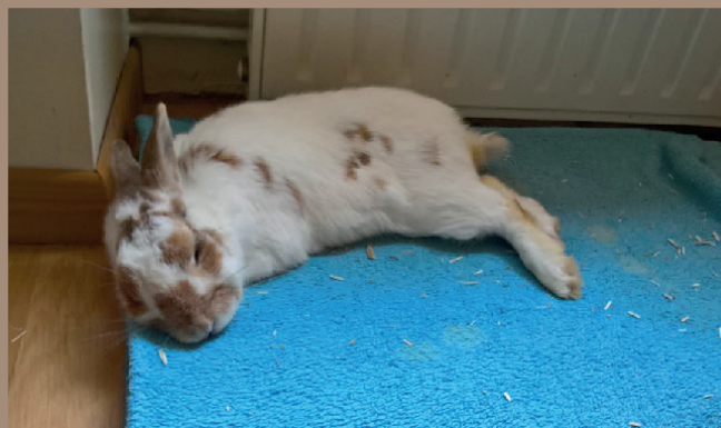
Petite sieste paisible sous le radiateur.

Une cage d'un mètre vingt dans mon 18 m 2 ? Impensable. Outre le fait qu'il s'agit de l'habitat le moins adapté qui soit au lapin, je n'en avais pas la place. Un enclos ? J'ai opté pour cette solution dans un premier temps afin de lui apprendre la propreté. Quel soulagement lorsque j'ai pu m'en débarrasser ! Condamner la moitié de son lieu de vie dans un studio riquiqui, devoir déplacer les grilles pour bouger la chaise ou accéder aux étagères, plus jamais.