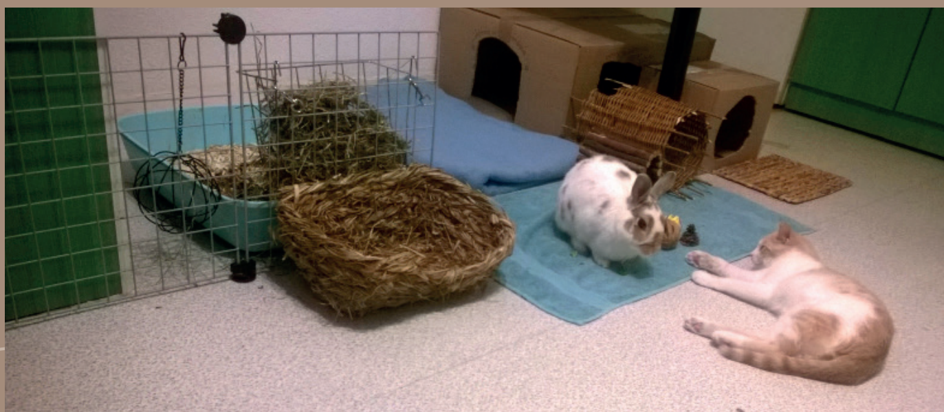
Jadis et son copain, Hélios. Y'a même de la place pour le chat ici !

Bien sûr, on peut tout à fait envisager de créer différents « points lapins » en fonction de l'agencement de son appartement : les gamelles vers la cuisine, la litière et le foin sous le bureau, le coin dodo à côté du lit, etc. Le lapin est un animal qui prend peu de place : dessous de table ou de bureau, un compartiment vide de bibliothèque, tout peut lui être réservé ou aménagé pour lui confectionner des aires de divertissement. Jadis n'étant pas spécialement expressive dû à un passé douloureux, elle n'était donc pas du genre à avoir besoin d'énormément de jouets et autres accessoires pour se défouler et s'occuper. Le soir je lui sortais son tunnel rétractable (et donc facile à ranger), mais ce qu'elle préférait c'était la compagnie des chats que j'avais en accueil. Un humain, un lapin et un chat dans 18 m 2 ? Même pas peur !