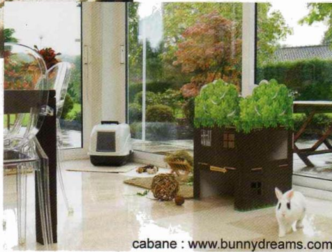
cabane : www.bunnydreams.com

simple terrier devient rapidement un réseau complexe de galeries et de chambres dans lesquelles les occupants migrent au gré de leurs occupations et affinités. L'habitat est non seulement un espace de sécurité et de repos mais aussi une grande source d'activités : creuser et déblayer la terre, ronger les racines qui gênent la progression des galeries, entrer et sortir par divers points d'accès... Tout ceci est impossible pour le lapin vivant en milieu artificiel.