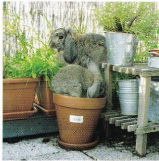
2.Tentative de rapprochement