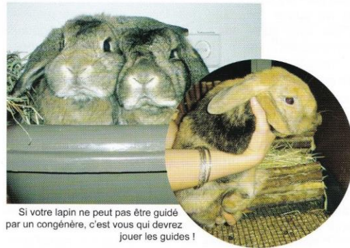
Si votre lapin ne peut pas être guidé par un congénère, c'est vous qui devrez jouer les guides !

peut ronger. Vous ne devez pas non plus le punir en l'enfermant dans une cage à chaque fois qu'il tente de ronger. Un lapin qui ronge exprime sa frustration, sa colère ou tout simplement le besoin naturel d'user ses dents. En le punissant vous ne faites qu'amplifier la frustration et vous ne faites passer aucun message positif. A l'inverse, en proposant au lapin un objet qu'il a le droit de ronger, vous lui fournissez de quoi évacuer la frustration, il n'a donc plus aucune raison de s'acharner sur autre chose. Bien évidemment, selon le caractère du lapin, il peut être nécessaire de montrer l'exemple plusieurs fois, surtout s'il s'agit d'un jeune lapin. Tous n'ont pas les mêmes facultés d'apprentissage.